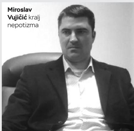
Miroslav Vujičić kralj nepotizma

"To je potpuno pogrešan koncept demokratije. To bi trebalo da bude sistem gdje ljudi koji rade u javnoj upravi i preduzećima služe narodu, a ne obrnuto. Kod nas je situacija da su političari preplaćeni, da se osjećaju zaštićeni i da im niko ništa ne može, zbog čega i postoji ovako otvoren nepotizam. Mehanizmi kontrole javnog žigosanja, osuđivanja i kažnjavanja ništa ne rade, jer je sve odjednom postalo sistem prelaspodjele plijena nakon izbora. Tako da se stvari koje su potpuno neprirodne, nenormalne i koje potpuno štete razvoju zemlje, smatraju prihvatljivim. Ono što je najgore, vi ako nemate pamet, znanje, struku i vještinu niste podobni da napravite uslove koji su potrebni poslovnom čovjeku i građaninu. Tako da je i zbog nepotizma BiH došla na dno evropske ljestvice zemalja po ekonomskom pitanju. Jednostavno, kod nas je sve što je budžetski definisano podređeno političarima i njihovoj rodbini i prijateljima", zaključio je Pavlović. ■