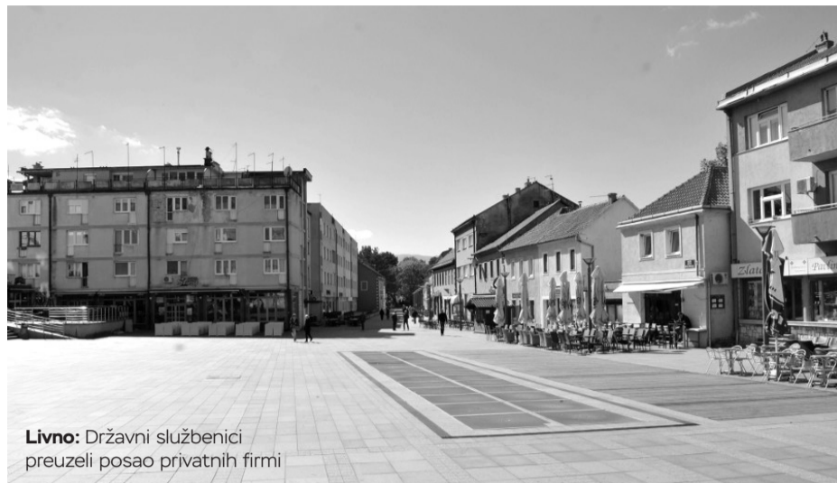
Livno: Državni službenici preuzeli posao privatnih firmi

Uposlenica Službe za graditeljstvo, prostorno uređenje i stambeno-komunalne poslove Ivanka Karaula kaže da je suviše razgovarati o učešću državnih službenika u pravljenju arhitektonskih projekata.