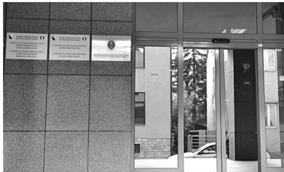
Agencija za bankarstvo RS: Uspostavljen interni sistem za procjenu banaka