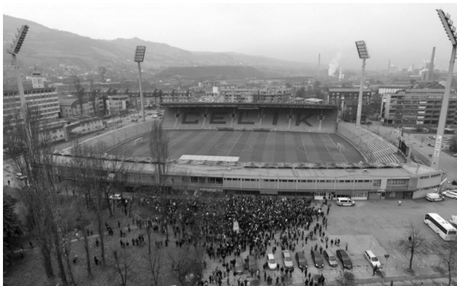
Travnjak Bilinog polja održava firma Alba i za to joj godišnje općina plaća 154 hiljade KM!